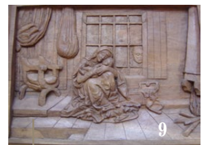
9. Vierge à l'enfant dans un intérieur, d'après Mantegna et Rembrandt. Noyer. 3 x 37 x 50 cm.