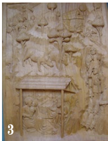
3. L'adoration des bergers, d'après un dessin italien du XV e siècle. Chêne. 4 x 59 x 81 cm.