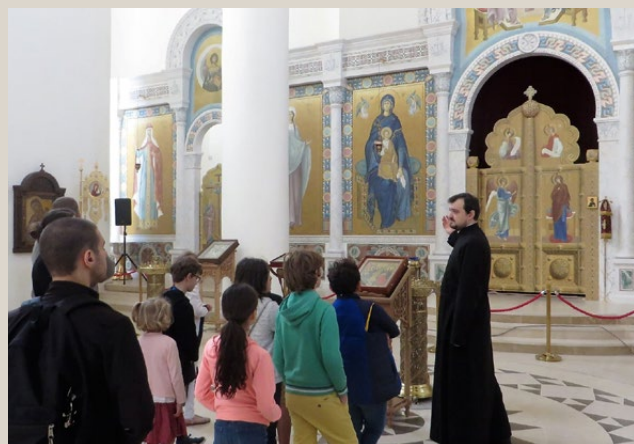
Visite de la cathédrale de la Saint-Trinité de Paris (Église orthodoxe russe).

Les jeunes ont également eu la possibilité de suivre une initiation à la batterie et aux percussions. Le centre de loisirs de la Nico permet aux enfants de s'amuser mais aussi de découvrir ou redécouvrir les grands monuments de Paris et leur histoire !