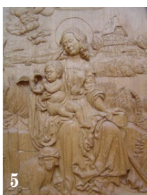
5. Vierge à l'enfant, d'après une gravure de Dürer. Chêne. 4 x 40 x 68 cm.