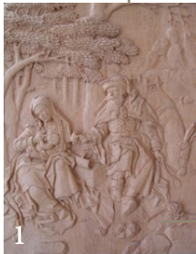
1. Le repos de la Sainte Famille, d'après une gravure de Maître E.S. Chêne. 4 x 65 x 73 cm.