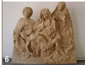
6. Déploration sur le Christ mort, d'après une gravure de Maître E. S. Chêne massif. 8 x 47 x 47 cm.