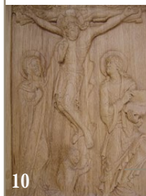
10. Crucifixion, d'après une enluminure romane. Chêne. 4 x 40 x 60 cm.