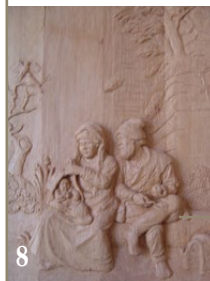
8. Le repos de la Sainte Famille, d'après un dessin de Rembrandt. Chêne. 4 x 43 x 53 cm.