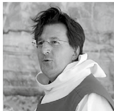
Le père Jacques Ollier.