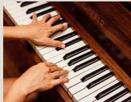
CCO Creative Commons

Si l'une de nos activités vous intéresse, n'hésitez plus ! Un cours d'essai vous est offert.