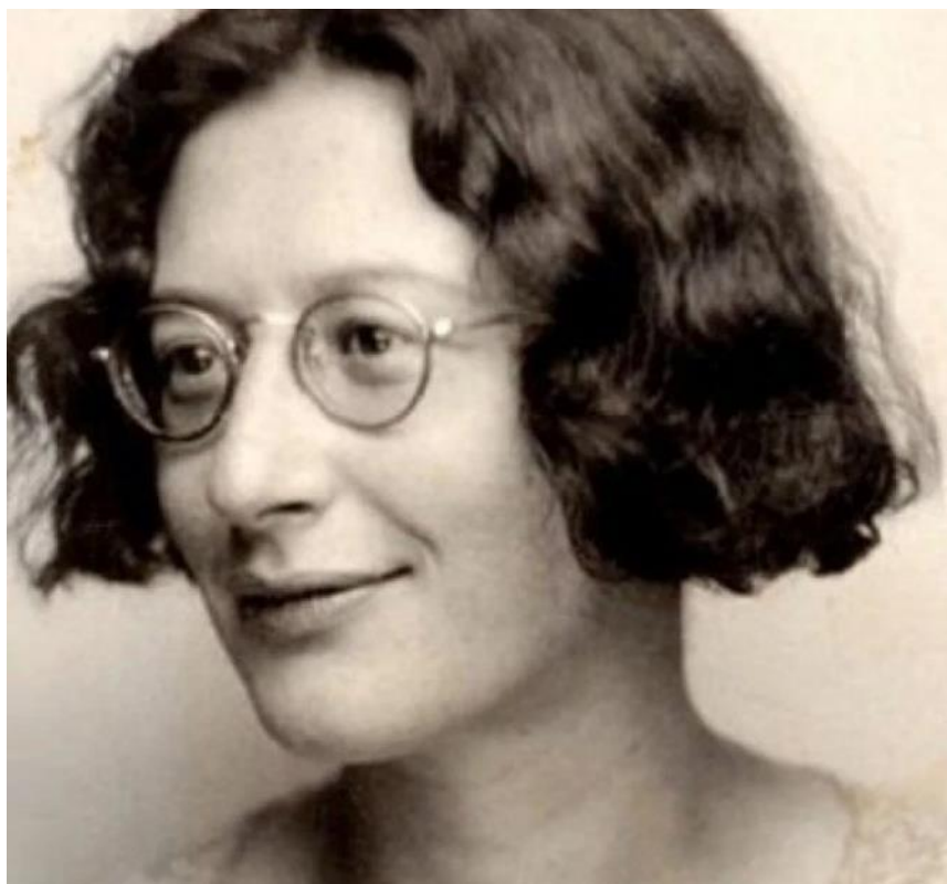
Simone Weil : 1909-1943

« Dieu Tout-Puissant, éternel, juste et bon, par nous-mêmes nous ne sommes que néant et pauvreté ; mais Toi, à cause de Toi-même, donne-nous d'agir selon Ta volonté, telle que nous La connaissons, et de vouloir toujours ce qui Te plaît ; ainsi nous deviendrons capables, intérieurement purifiés, illuminés et embrasés par le feu du Saint-Esprit, de suivre les traces de ton Fils, Notre Seigneur Jésus-Christ, et par Ta seule grâce, de parvenir jusqu'à Toi, Très-Haut, qui, en Trinité parfaite et très simple Unité, vis et règnes et reçois toute gloire, Dieu Tout-Puissant dans tous les siècles des siècles. Amen. »