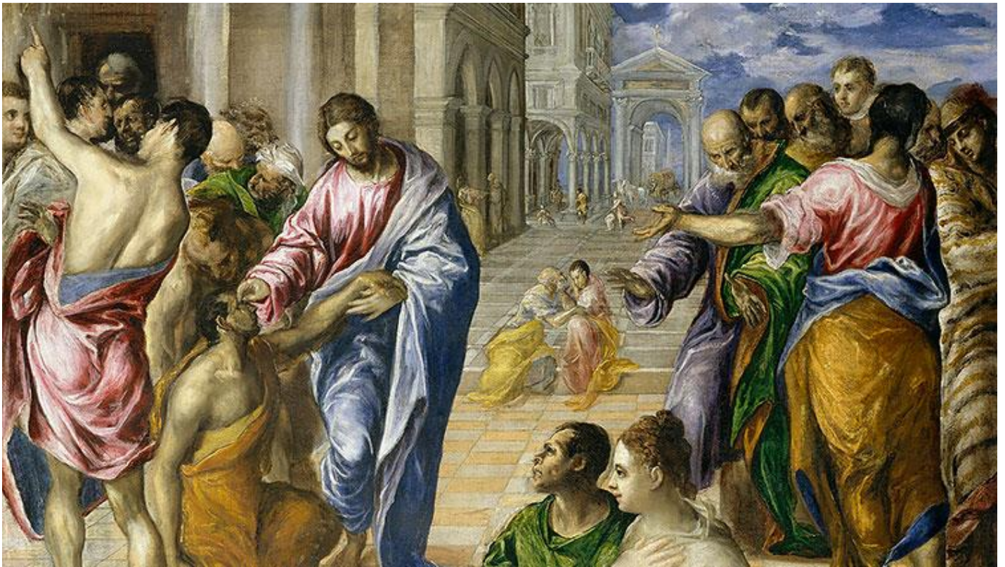
Le Greco 1541-1614, Le Christ guérissant un aveugle 1570, MET New York