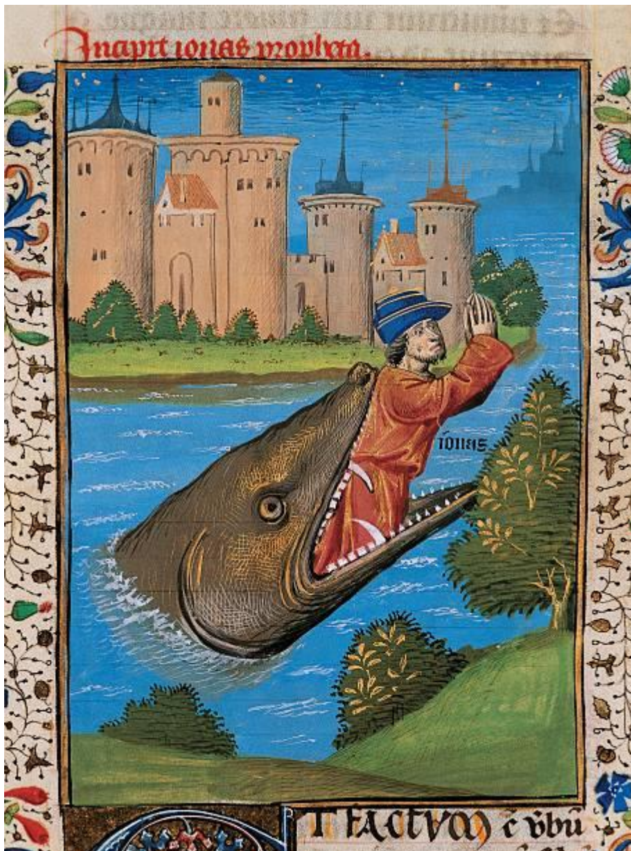
Jonas rejeté par le grand poisson extrait de la bible du pape Jean XXII (XIVe siècle).

Et ne nous laisse pas entrer en tentation mais délivre-nous du Mal. Amen