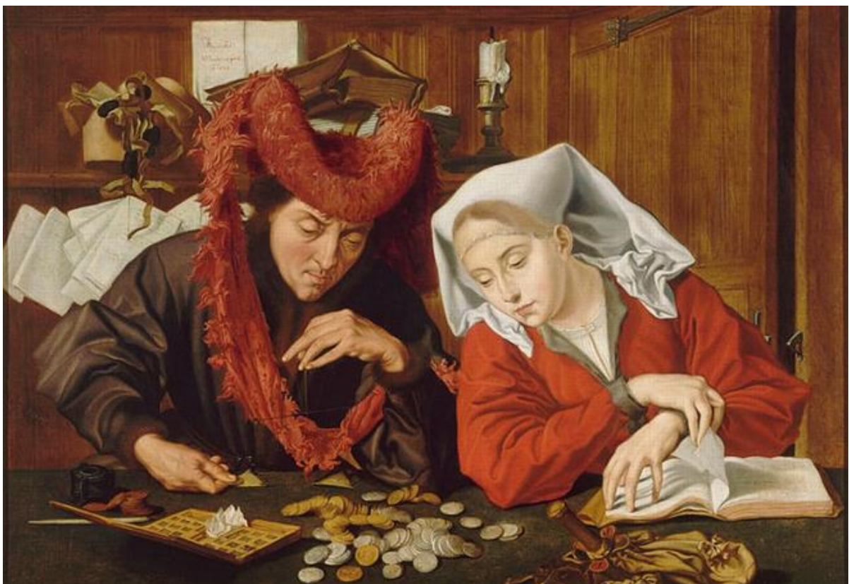
Marinus_van_Reymerswale_1540. Le changeur et sa femme.

Prière à écouter (Mendiez, mendiez) cliquer ici