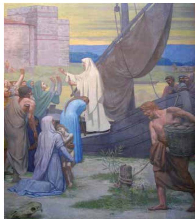
Sainte Geneviève ravitaillant Paris, Pierre Puvis de Chavannes (1898, Panthéon).

La présence de Geneviève est repérable en bien des lieux de Paris et de sa proche banlieue : autour de la cathédrale Notre-Dame (4 e ) ; sur la Montagne Sainte-Geneviève à Saint-Etienne du Mont (5 e ) qui porte son nom évidemment, près de Louvre avec Saint-Germain l'Auxerrois (1 er ) ; à Saint-Denis (93) où elle fit construire la première cathédrale ; à Nanterre (92) où elle est née. Toutes les paroisses et com-