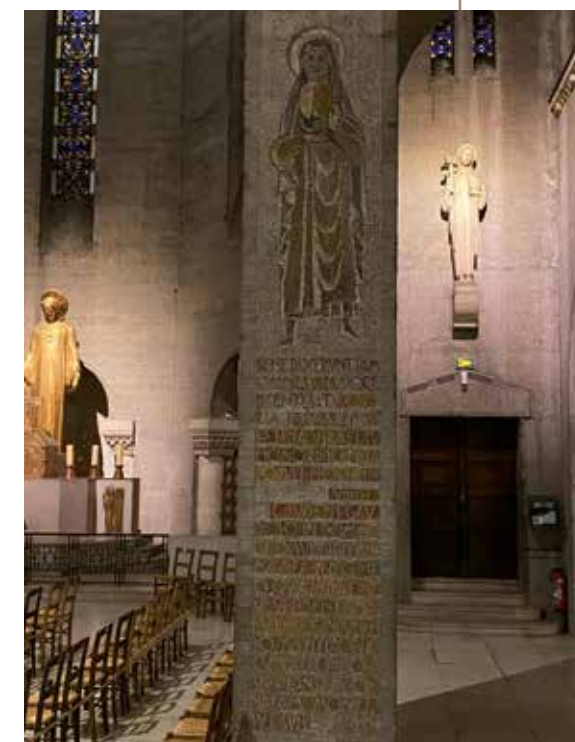
Double patronage de sainte Geneviève visible sur la peinture murale de notre église. Dans sa main, le bateau qui représente Paris et sa devise « fluctuat nec mergitur » et au-dessus la mention du patronage de Sainte-Geneviève sur la France (Gallica). À l'arrière plan, la statue de sainte Geneviève avec dans sa main le cierge avec lequel elle est le plus souvent représentée. Sainte Geneviève fut et reste une lumière pour Paris.

Nos saintes patronnes sont vêtues : « Le Seigneur la suscita, aussi la jeune fille revêtit-elle l'armure de Dieu pour pouvoir s'opposer aux embûches des ennemis. » (Antienne des vêpres de la fête de Jeanne d'Arc). Sous Geneviève : « Tous la bénirent d'une seule voix et lui dirent : Tu es la gloire de Jérusalem, tu es la fierté d'Israël, tu es l'honneur de notre peuple » (Judith 15, 9). « Je suis remplie d'allégresse dans le Seigneur, mon âme exulte en mon Dieu, car il m'a revêtu de l'habit du salut, il m'a drapée dans le manteau de la justice, comme la fiancée qui se pare de ses atours » (Isaïe 61, 10). Superbes métaphores du cierge allumé, du vêtement donné : c'est la foi, l'éducation, l'instruction, la culture que l'on doit enrichir de ses dons selon sa vocation propre et transmettre. Ce que fit