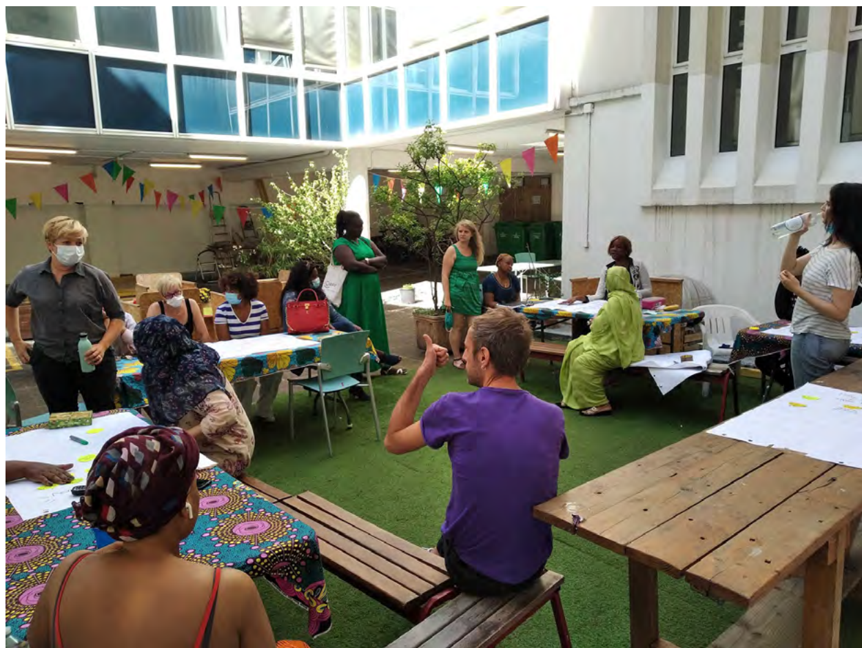
L'hébergement et l'accompagnement sont comme une rééducation à la vie en société.

Aurore a 150 ans. L'organisme de réinsertion, créé en 1871, est reconnu d'utilité publique en 1875, et défini en 1879 par le conseil d'administration comme une œuvre laïque, qui deviendra association avec la loi de 1901. Aurore est spécialisée dans l'accueil et l'accompagnement de personnes en situation de précarité ou d'exclusion jusqu'à leur autonomie, par l'hébergement, le soin, la formation, en expérimentant des techniques innovantes pour rester toujours au plus près des besoins réels.