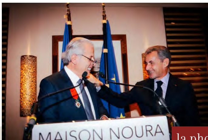
la photo du mois

Samedi 25 décembre 11h : messe du jour de Noël 17h30 : messe en italien