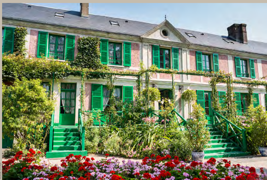
La maison de Claude Monet.